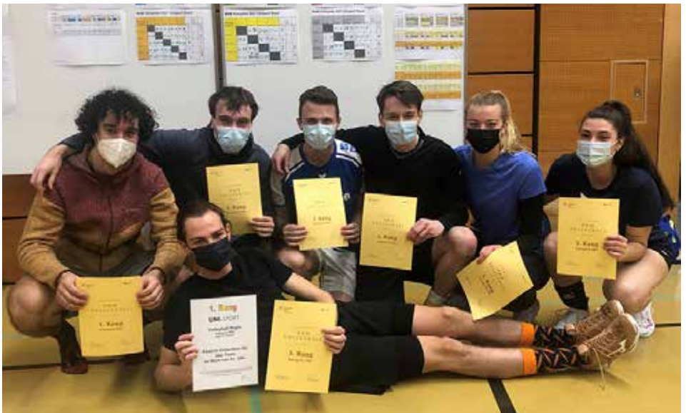
Waikiki Beach Bombers - das Siegerteam an der BHM Volleyball, Kategorie Pro