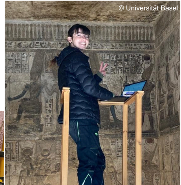
Deir el-Medina in der griechisch- römischen Zeit