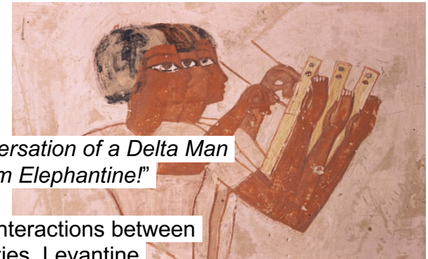
"Like the Conversation of a Delta Man with a Man from Elephantine!" (LCDE)

Exploring the Interactions between Dialectal Realities, Levantine Loanwords, and Sociolinguistic Dynamics in New Kingdom Egyptian