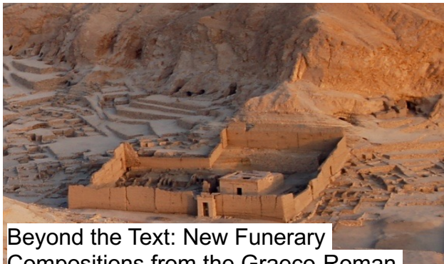
Beyond the Text: New Funerary Compositions from the Graeco-Roman Period: Textualities and Archaeology in Thebes