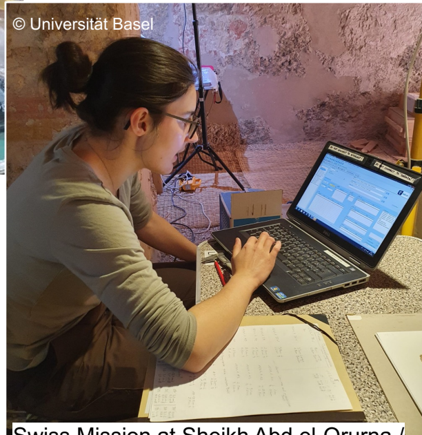
Swiss Mission at Sheikh Abd el-Qurna / Life Histories of Theban Tombs (LHTT)