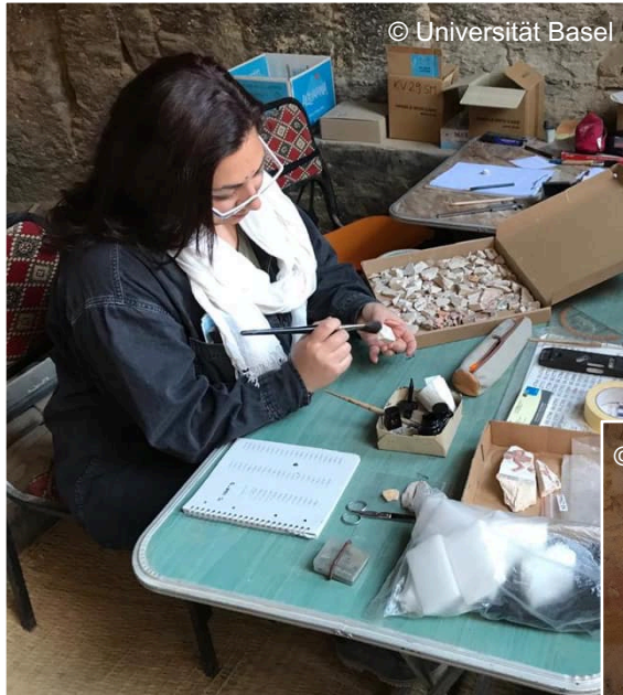
University of Basel Kings' Valley Project