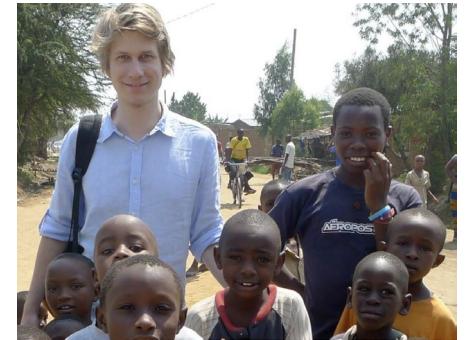
Christoph Food and Agricultural Organization