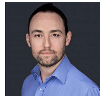
Christopher International Institute of Sustainable Development