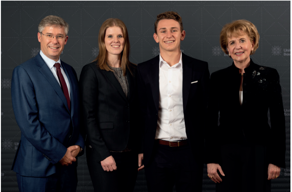
Beat Braun Basler Versicherungen