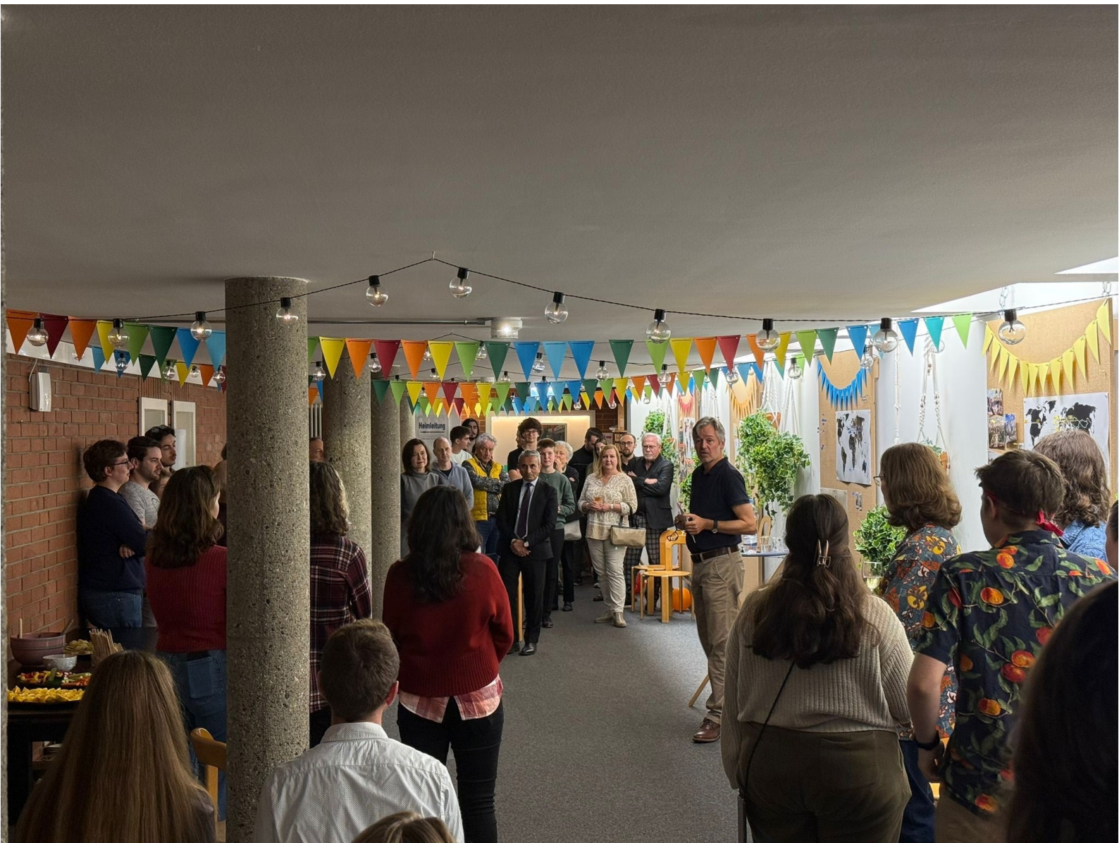
Festakt zum 60jährigen Bestehen des studentischen Wohnheims Mittlere Strasse 33