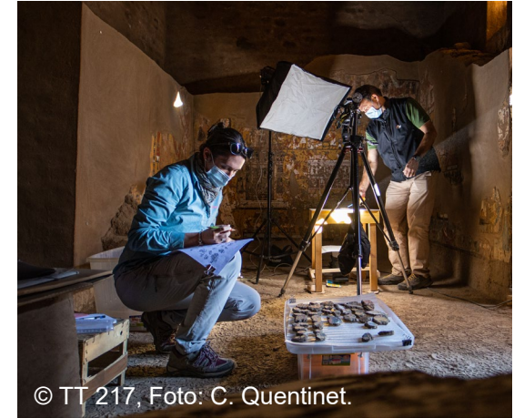
© TT 217, Foto: C. Quentinet.